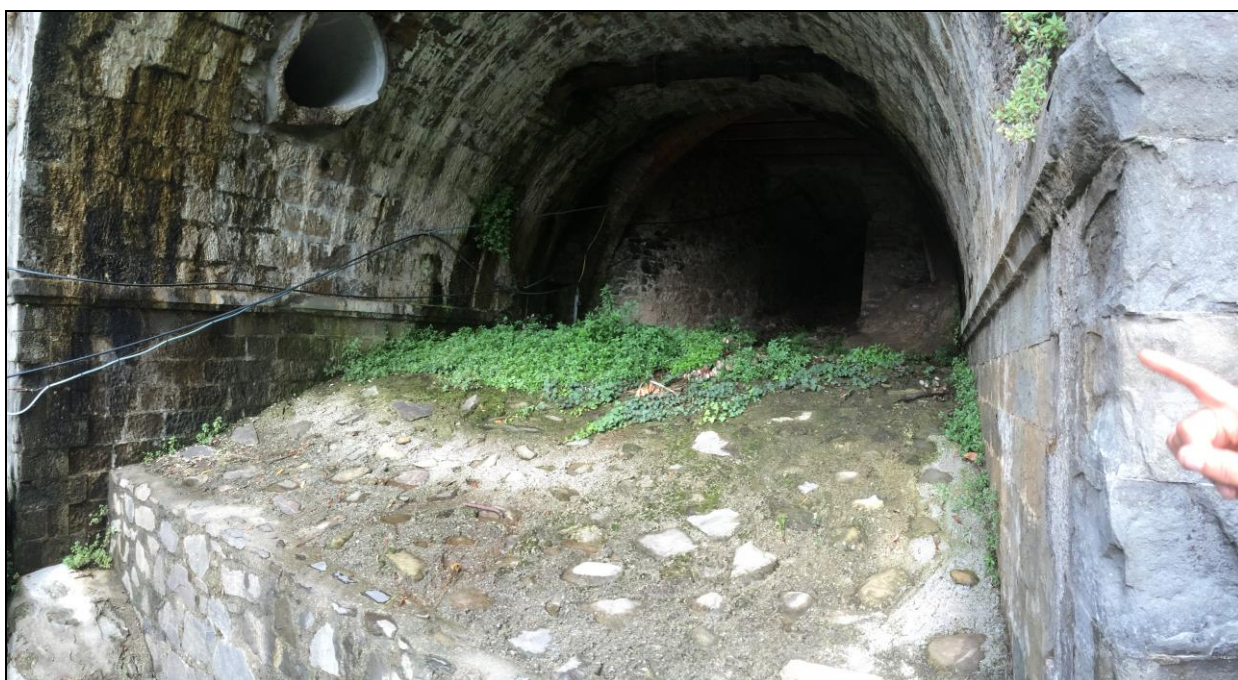
Foto n.5 Vista dell'attraversamento su Via PROVINCIALE del Canale della Mora