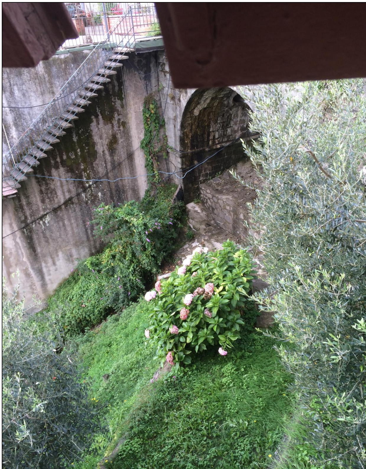
Foto n.3 Vista imbocco dall'attraversamento Via PROVINCIALE del Canale della Mora