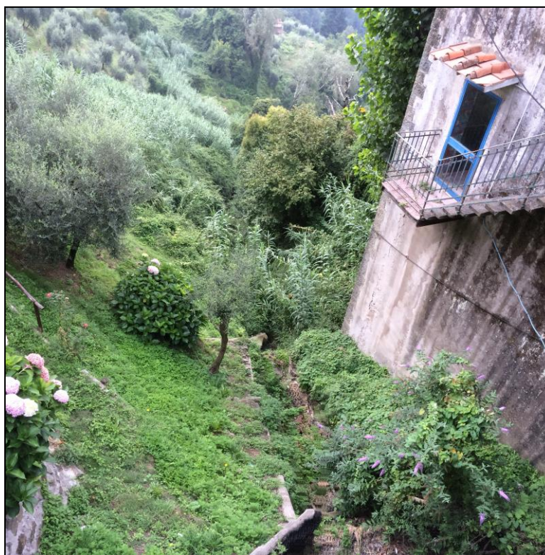
Foto n.2 Vista ambito all'imbocco dall'attraversamento Via PROVINCIALE del Canale della Mora