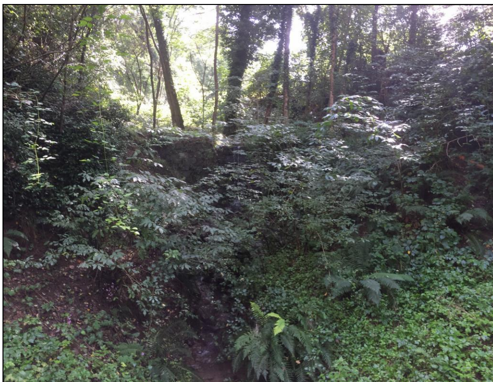
Foto n.13 Vista 3° Attraversamento a monte su Via dei Canali ( ex Via Vecchia Mammianese).