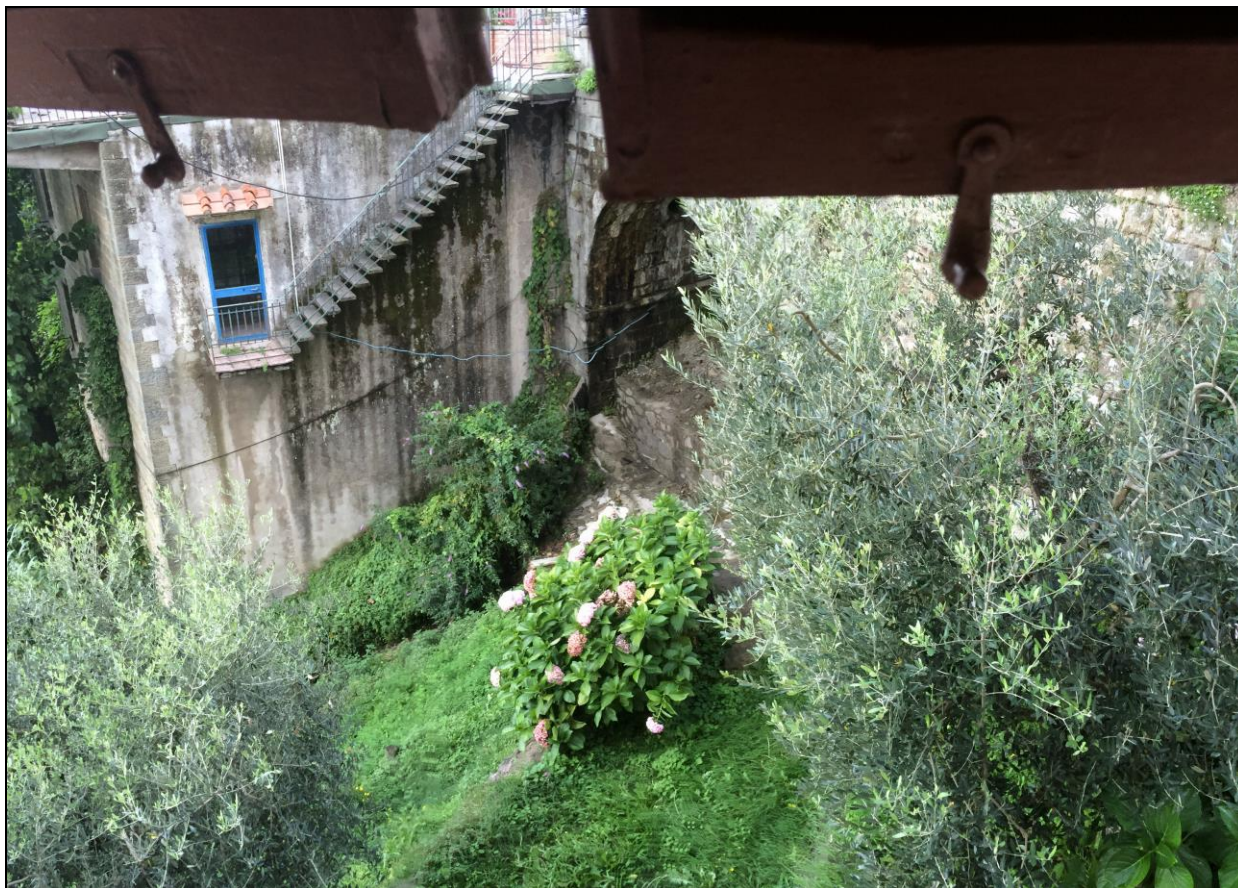
Foto n.4 Vista imbocco dall'attraversamento Via PROVINCIALE del Canale della Mora