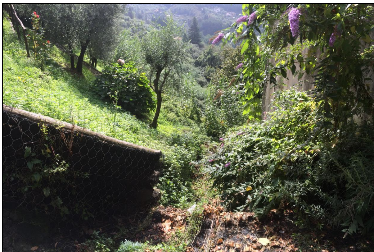
Foto n.7 Vista del Canale della Mora in alveo.