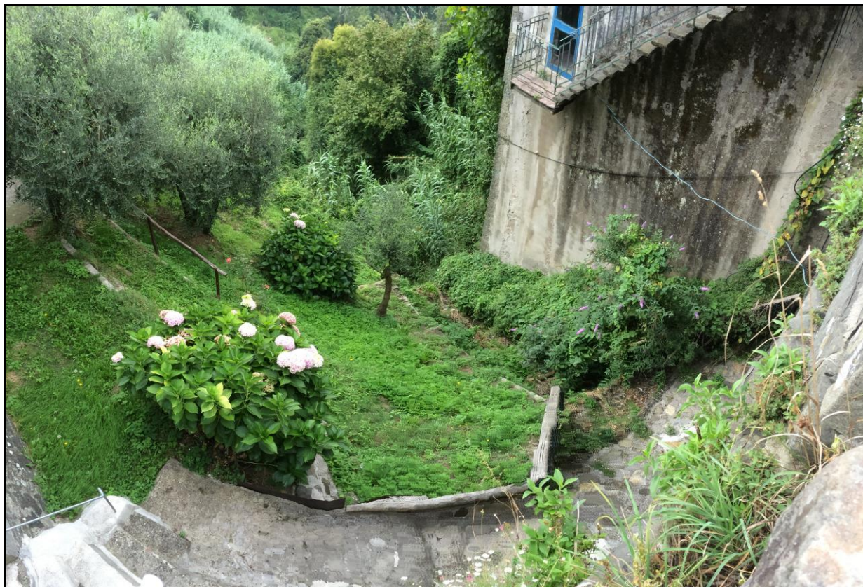
Foto n.1 Vista ambito all'imbocco dall'attraversamento Via PROVINCIALE del Canale della Mora