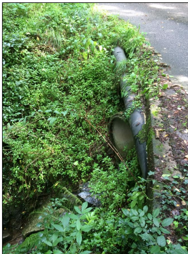
Foto n.11 Vista 2° Attraversamento avalle su Via dei Canali ( ex Via Vecchia Mammianese).