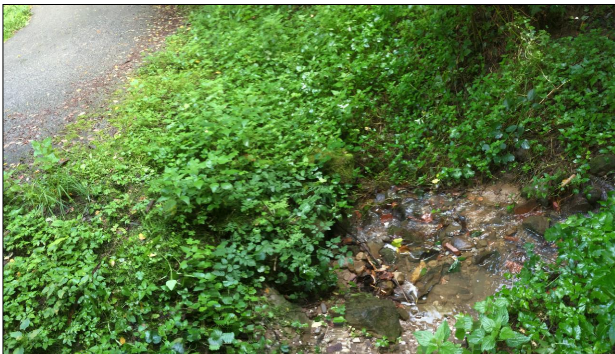
Foto n.8 Vista 1° Attraversamento a monte su Via dei Canali ( ex Via Vecchia Mammianese)