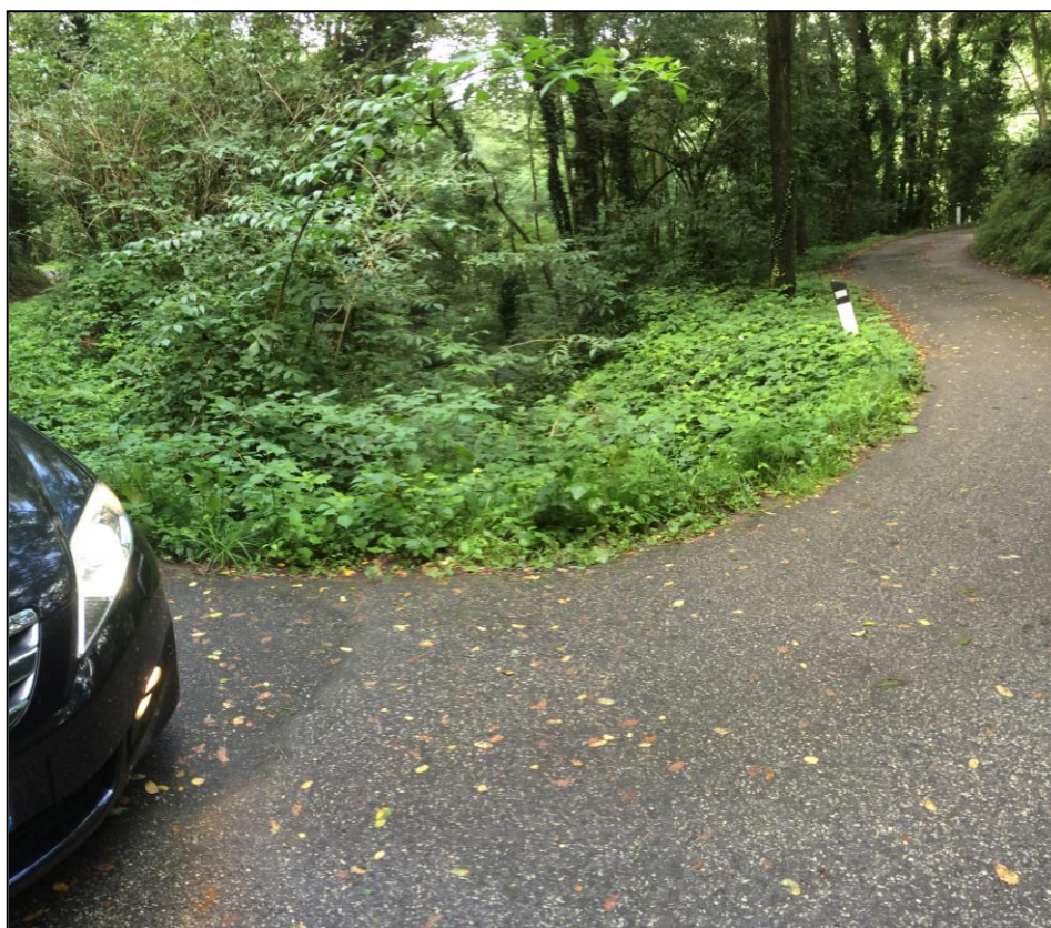
Foto n.9 Vista 1° Attraversamento a valle su Via dei Canali ( ex Via Vecchia Mammianese).