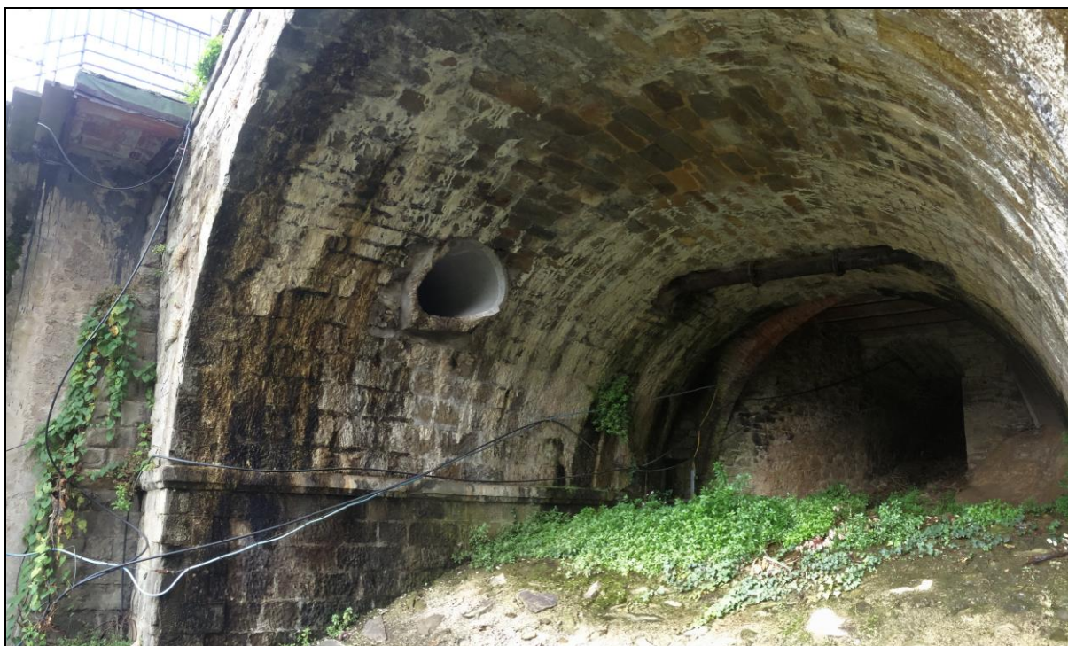
Foto n.6 Vista dall'attraversamento Via PROVINCIALE del Canale della Mora con collettore acque paese