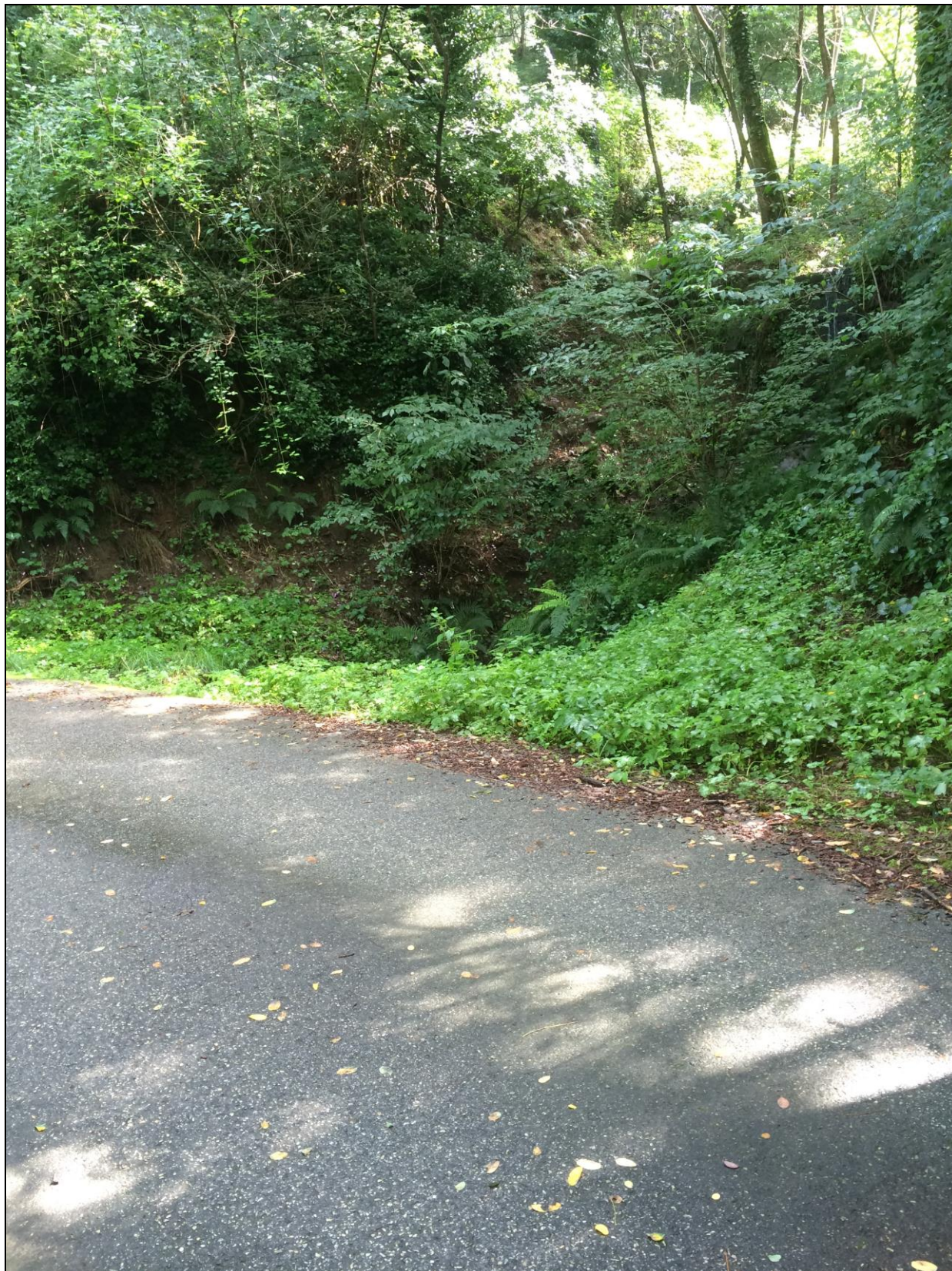
Foto n.12 Vista 3° Attraversamento a monte su Via dei Canali ( ex Via Vecchia Mammianese).