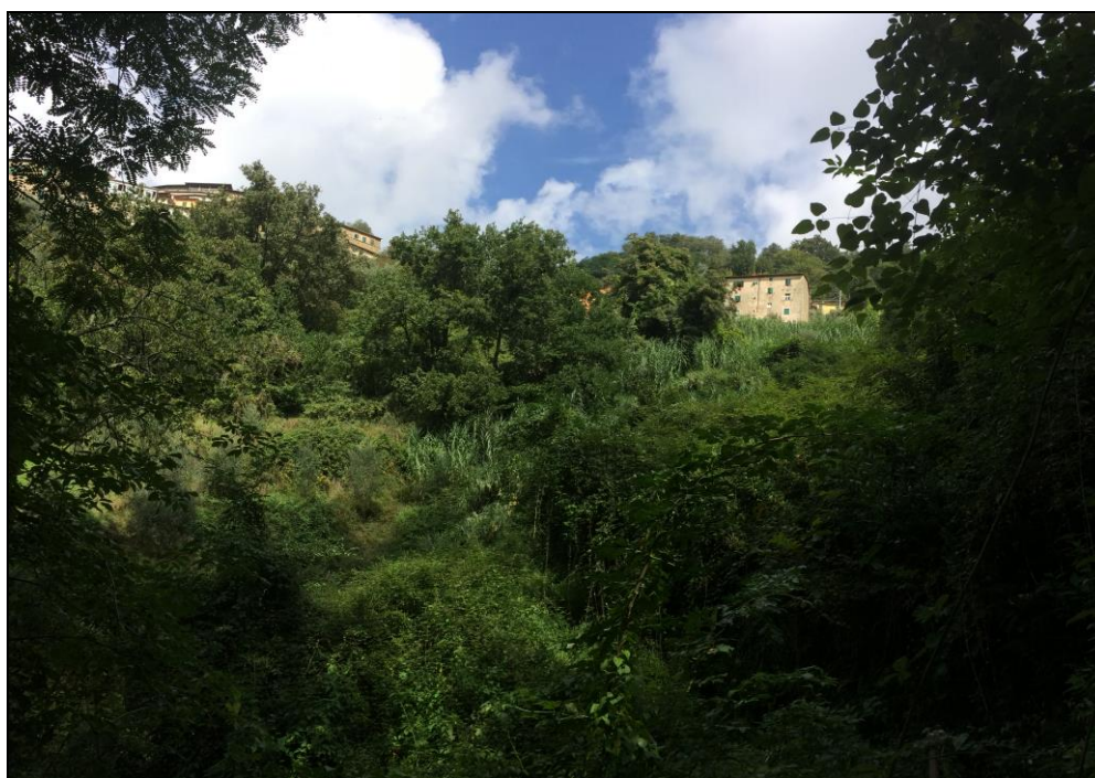
Foto n.14 Vista a monte del Canale della Mora nella posizione del vecchio Attraversamento su Via dei Canali ( ex Via Vecchia Mammianese).